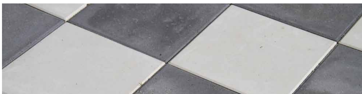
Bender Star slät platta supervit i kombination med Bender slät platta grafit ger en utmärkt kontrastskillnad.