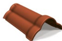
Nockpanna Kleeblatt naturröd H304 24