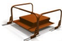
Taklucka med skyddsränne