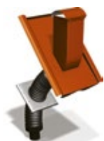
Avloppsluftare i plåt