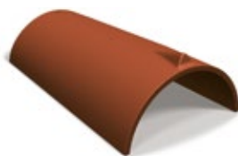
Nockpanna universal naturröd H300 24