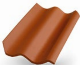
Höganäs 2-kupig naturröd L201 24