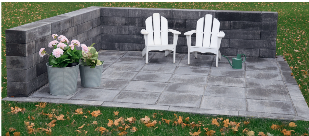
Bild 1. Exempel på hörn och slutbyggnationer i tredjedelsförband, samt kantstenssättning, med Stringent.

4. Muren kan avslutas som den är eller med Toppsten 400x250x60 mm alternativt Toppsten 400x200x50 mm. För svåra markförhållanden rekommenderas gjutning av betongsula som grund för muren.