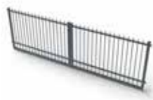
Classic smidesport 4000x1250 mm Art nr 2974050