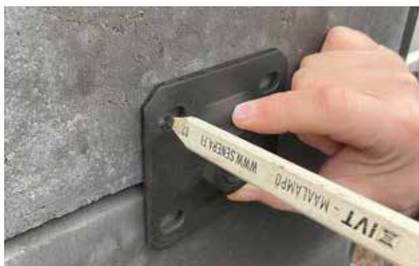
Bild 3. Smidesgrundens gängjärnsplatta.