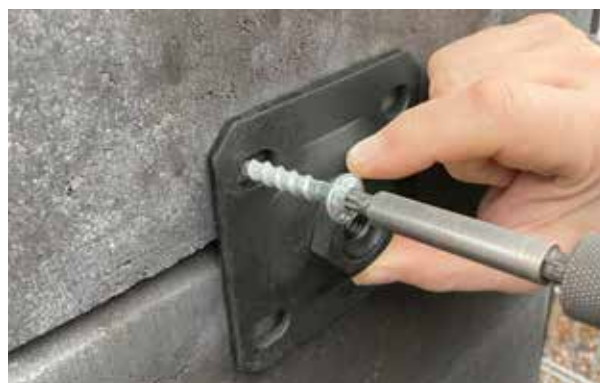
Bild 4. Gängjärnsplattans betongskruv.