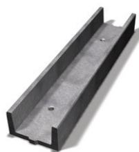
Bender Kabelränna 535 mm