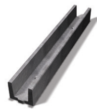
Bender Kabelränna 350 mm