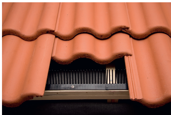
Montering av fågelband