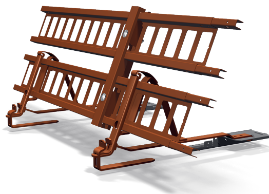
Bild: Snörasskydd profildurk SAFE monterat med Förhöjningsfäste.