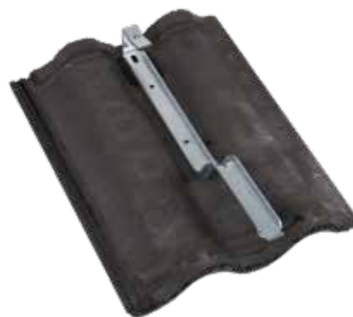
Bild 2. Läktfäste under den förstärkta betongpannan.