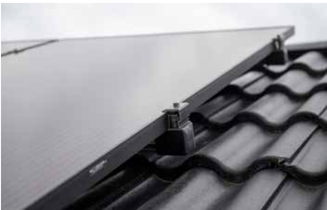
Bild 7. Ändklämma med monterat Ändlock

Tryck ned mittklämma i skenan och vrid 90°. Placera Mittklämma mot den första panelen och tryck emot den andra panelen. Skruva fast (15Nm) mittklämma (bild 8).