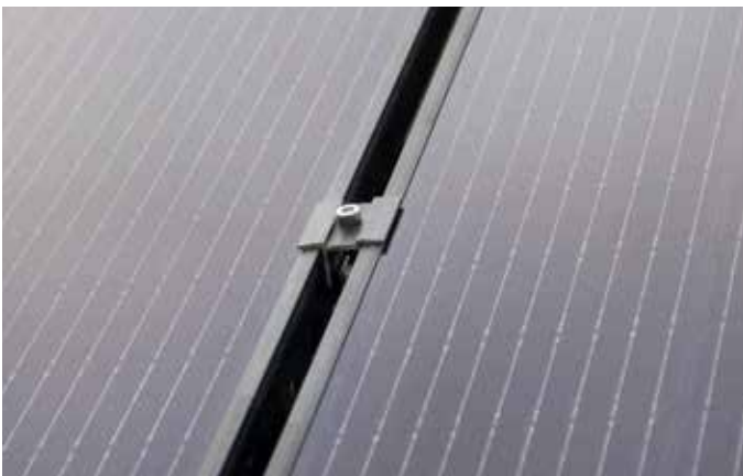
Bild 8. Mittklämma monterad.