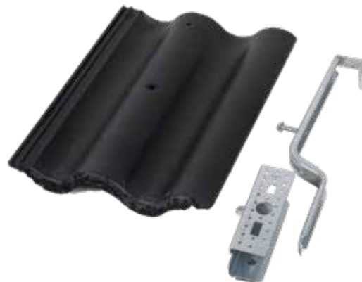
Bild 1. Infästningspanna Solar består av 3 delar.

Montera Infästningspannorna enligt Snö- och vindlastberäkning på läkten. Justering av höjd av konsolen i förhållande till taket görs med bult enligt bild 4. Säkerställ att bulten är dragen med minst 45 Nm.