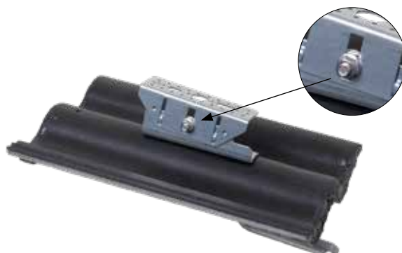
Bild 4. Höjjustera konsolen. Säkerställ att bulten är dragen med minst 45 Nm.