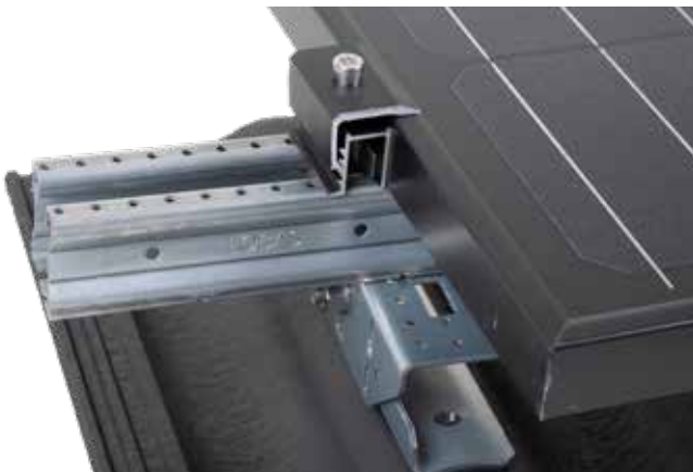
Bild 6. Montering av Ändklämma.

Placera första solpanelen minst 70 mm in från skenans avslut, och skruva fast (15Nm) panelen med Ändklämma (bild 6). Vid behov, kapa skenan, och trä därefter på Ändlock (bild 7).