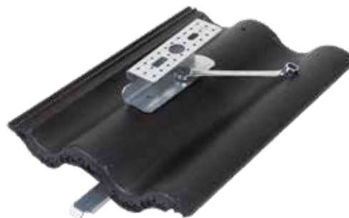
Bild 3. Skruva fast konsolen på ovasidan.