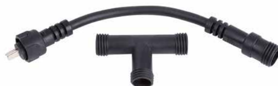
Bild 2. Kabel och T-koppling

T-koppling kan med fördel användas för transformatorns 12V sida för förgrening höger/vänster. T-kopplingen går även att använda före skarv av förlägningskabel.