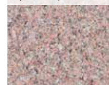
AXTVETEN ELEGANT (FLAMMAD)