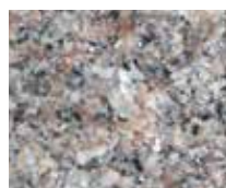
RÖD ÄVJA RUSTIK (RÅKILAD)