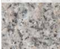
NÄSINGE ELEGANT (FLAMMAD)