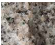
NÄSINGE RUSTIK (RÅKILAD)