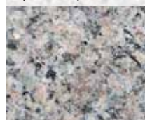
RÖD ÄVJA ELEGANT (FLAMMAD)