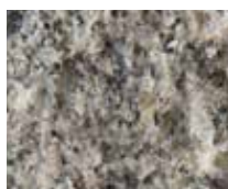
ÄVJA RUSTIK (RÅKILAD)