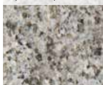
ÄVJA ELEGANT (FLAMMAD)