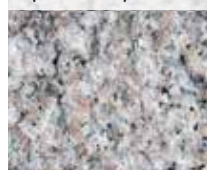
RÖD ÄVJA FINNESS (KRYSSHAMRAD)