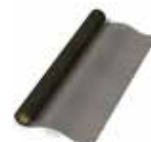
Geonät X-35 25x1,25 m Art nr 2912720

tjänstevikt. Kör försiktigt och ej för nära muren så att den ändrar läge.